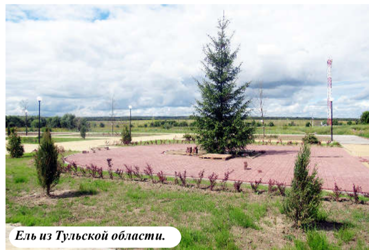
Ель из Тульской области.

«Это те работы, которые мы начали в про-