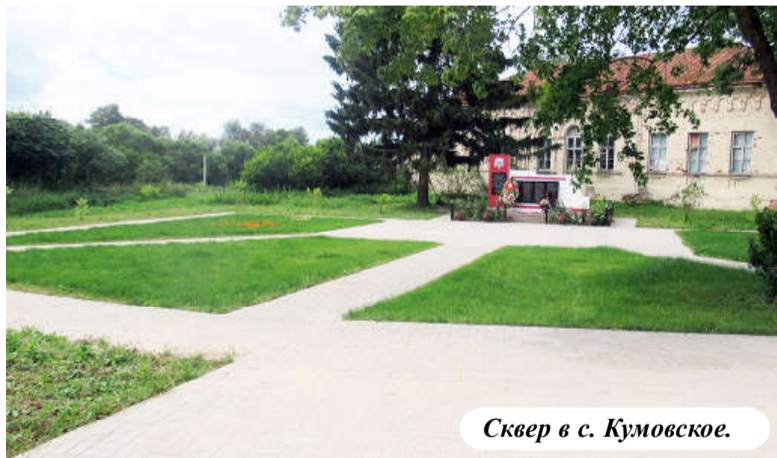
Сквер в с. Кумовское.

Проблемы? Они, безусловно, есть, но и решаем их мы путем участия в уже назван-