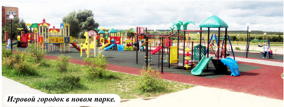
Игровой городок в новом парке.